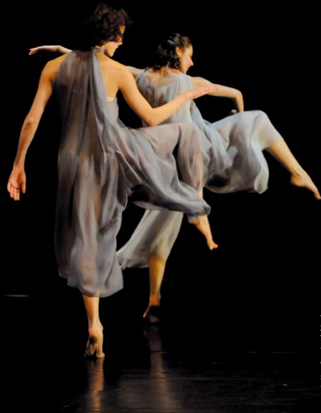
Set&Reset/Reset © Michel Cavalca

“The body is the place where all sorts of possibilities and dreams can blossom”.