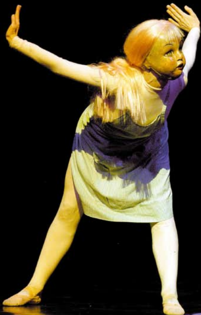
Cendrillon © Jean-Pierre Meaurio

“The fact that we no longer had to worry about facial expressions because they were hidden behind masks, nor even the bodies, all deformed as they were by the costumes, enabled me to take a « naive » or off-beat view of academic language”.